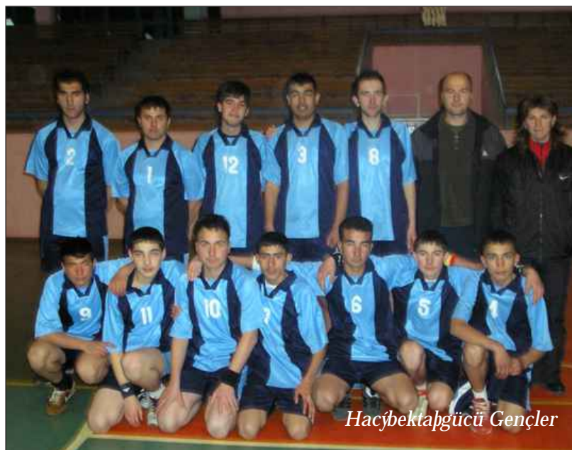
Hacıbektap gücü Gençler

Hacıbektap Kapalı Spor Salonu'nda önceki gün oynanan Hacıbektap gücü Gençler Basketbol Takımı - Avanos Gençler Takımı'na 30 - 54 yenildi.